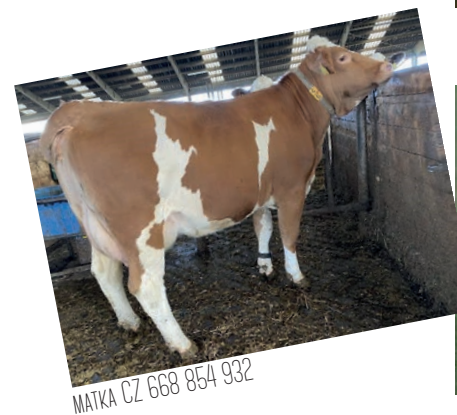
MATKA CZ 668 854 932